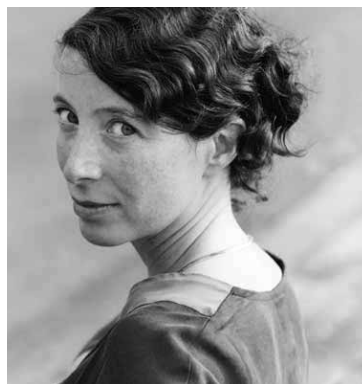
Ayelet Gundar-Goshen

jüdische Diaspora in Israel und den Vereinigten Staaten. Ebenfalls sehr erfreut sind wir darüber, im Sommer die israelische Schriftstellerin Ayelet Gundar-Goshen in München begrüßen zu können. Gundar-Goshen wird vom 2. bis 8. Juli im Rahmen der Amos Oz Poetik-Gastprofessur für Hebräische Literatur das Blockseminar „Writing the Nation’s History – Israeli Literature across the Generations“ anbieten.