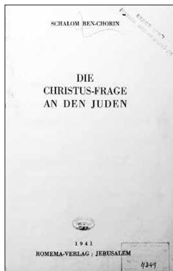
2 Schalom Ben-Chorin: Die Christus-Frage an den Juden. Jerusalem 1941

Um der Gefahr der Vereinnahmung durch die christliche Seite zu entgehen, solle, so Buber, das christlich-jüdische Gespräch