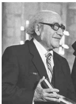
1 Schalom Ben-Chorin mit der Buber-Rosenzweig-Medaille, 1982