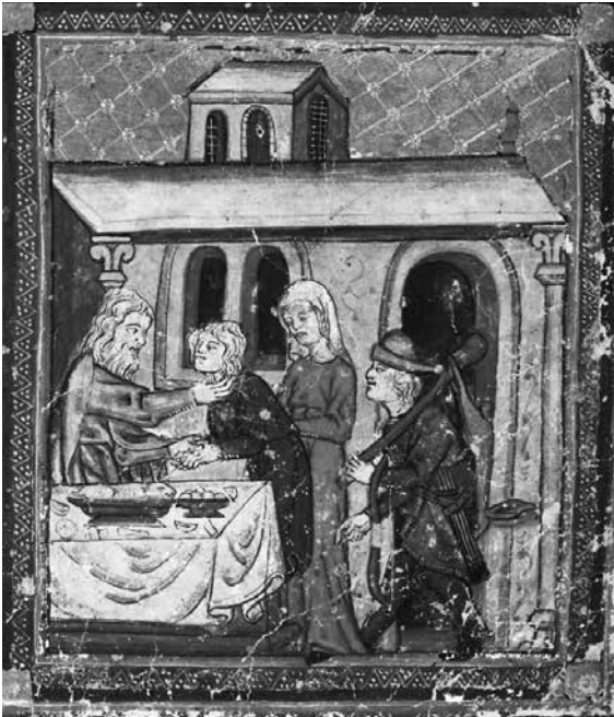
1 Versöhnung von Jakob und Esau, Illustration aus der sog. Goldenen Pessach-Haggada, ca. 1320–1330

Die Bezeichnung von Juden als Brüder zieht also eine lange Geschichte des brüderlichen Kampfes um Erbe und Erbfolge nach sich. Von dieser turbulenten Vergangenheit kann die Metapher nicht befreit werden. Würden Juden also tatsächlich damit einverstanden sein, sich selbst mit dem älteren Bruder zu identifizieren?