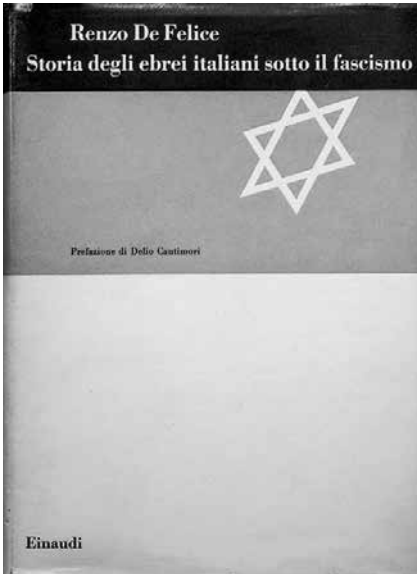
2 Buchcover von Renzo De Felice, Storia degli ebrei italiani sotto il fascismo (Turin: Einaudi, 1961)

rungsmaßnahmen schlugen für die meisten Juden und ebenso für die Union [der israelitischen Gemeinden Italiens] wie Blitze aus heiterem Himmel ( fulmini al ciel sereno ) ein.“ 5