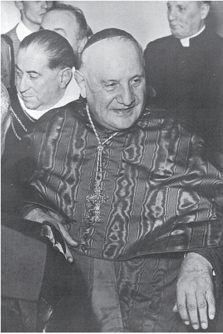
4 Kardinal Angelo Giuseppe Roncalli (1881-1963)

Griechenland und die Türkei lebte und wirkte er von Januar 1934 bis Dezember 1944 in Istanbul.