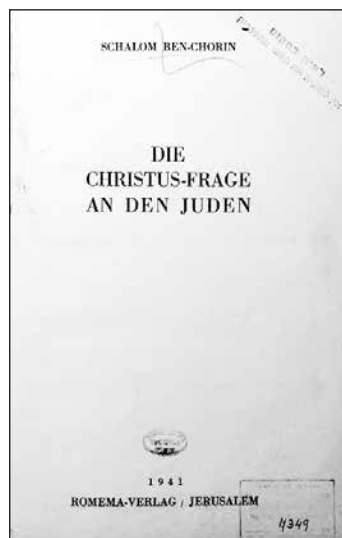
2 Schalom Ben-Chorin: Die Christus-Frage an den Juden. Jerusalem 1941

Um der Gefahr der Vereinnahmung durch die christliche Seite zu entgehen, solle, so Buber, das christlich-jüdische Gespräch