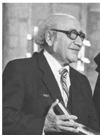
1 Schalom Ben-Chorin mit der Buber-Rosenzweig-Medaille, 1982